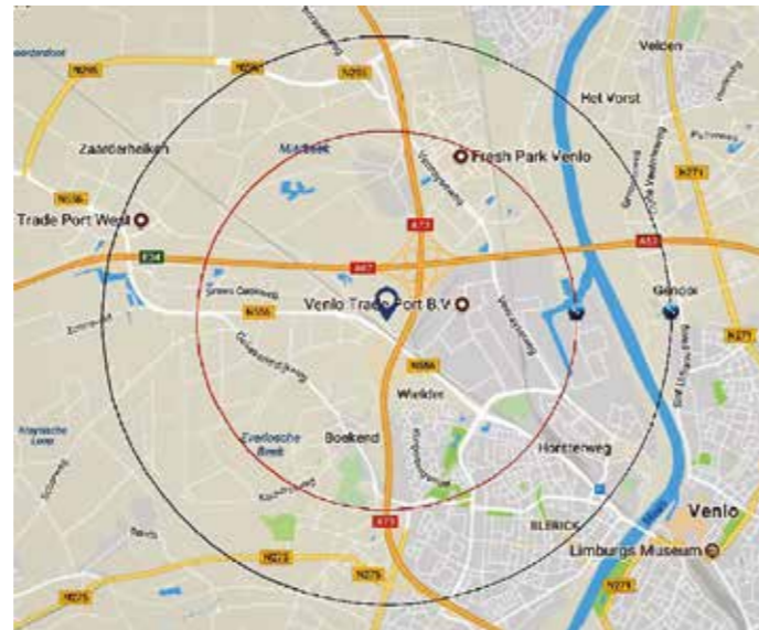
Cirkel 2 kilometer in rood, cirkel 3 kilometer in zwart

Op alle fronten wordt zéér in strijd gehandeld met een goede ruimtelijke ordening. Denk daarbij ook aan het feit dat de vijf windturbines richting Blerick buiten het voorkeursgebied liggen en voor het grootste deel gesitueerd zijn in de “goudgroene natuurzone”, het Limburgse deel van het “Nationaal Natuurnetwerk”, ter hoogte van verbindingzones. Tegenover het natuurgebied Crayelheide en het natuurreservaat Koelbroek(!).