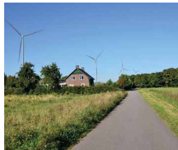
Visualisatie Heierkerkweg in Blerick. Achter deze woning komt op 400 meter afstand windmolen nummer 4. Daartussen liggen nog twee woningen.

Leefbaarheidsfonds Leudal ontvangt 300.000 euro voor de plaatsing van twee windmolens. Windpark Venlo geeft 500.000 euro uit voor de plaatsing van negen windmolens te verdelen over zeven buurten, waaronder Blerick, Boekend en Heierhoeve.